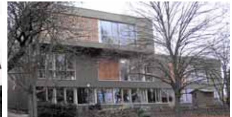
Pfarrheim und Kindergarten